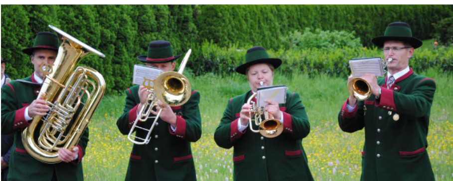
Die Lorenzer Weisenbläser zeichneten für das musikkaische Programm beim Spatenstich verantwortlich.