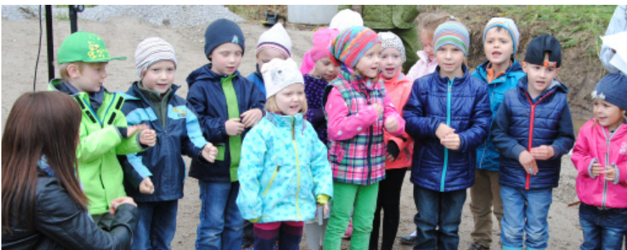
Mit dem Lied „Ein jeder kann kommen, für jeden machen wir die Türen auf“, sangen sich die Kindergartenkinder in die Herzen der Ehrengäste und Besucher.