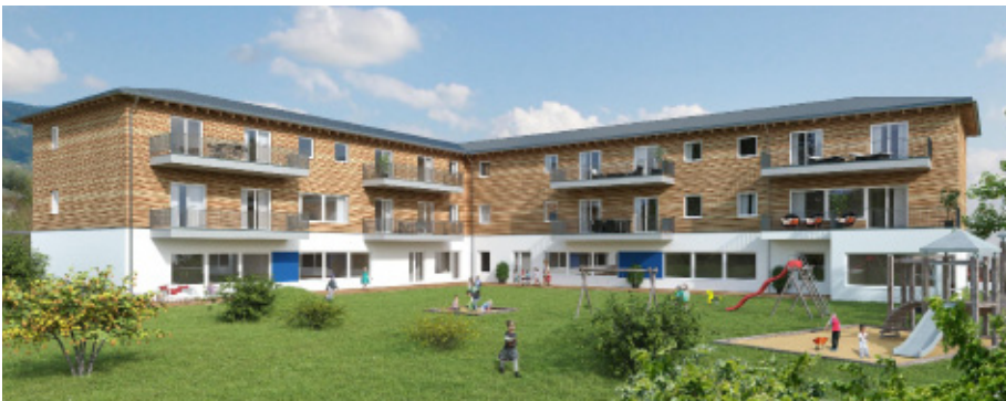
So sieht das Gebäude mit Kindergarten, Krabbelstube und altersgerechten Wohnungen aus.