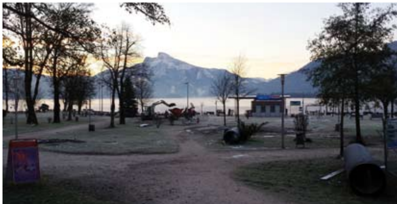
Vor der Einleitung in den Mondsee werden die Oberflächengewässer unter dem Seeparkplatz gereinigt.

Unter dem Seeparkplatz hat die Marktgemeinde Mondsee eine Gewässerschutzanlage errichtet. Dort werden die Oberflächenwässer des Marktes vorgereinigt, bevor sie in den Mondsee eingeleitet werden. „Für unsere Umwelt ist es gerechtfertigt, viel Geld in die Hand zu nehmen“, freut sich Vizebürgermeister Josef Wendtner,