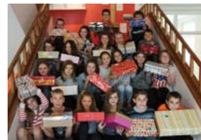
Die Aktion „Weihnachten im Schuhkarton“

Auch in diesem Jahr sammelten die Schüler der SMS im Religionsunterricht wieder Weihnachtspakete, um Kindern in Moldavien und Rumänien eine kleine Freude zu bereiten.