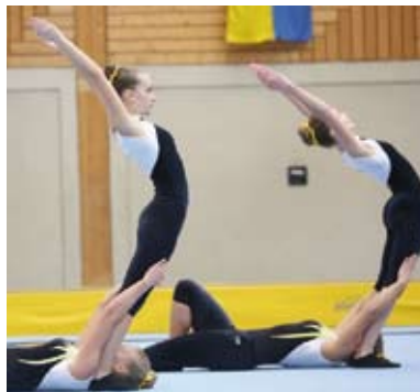
Geturnt wird in drei Disziplinen.

Bei den Staatsmeisterschaften im Teamturnen in Schwanenstadt konnten sich die Mondseerinnen den Staatsmeistertitel in der Wertungsklasse Team Turn10 sichern. Team Turn10 fungiert als die „Einsteigerklasse“ zum Teamturnen, einer Turnsportart bei der es mehr auf die Leistung einer Mannschaft als auf die einer Einzelperson ankommt. Geturnt werden drei Disziplinen: Akro-Showtanz, Minitrampolin-Springen und Tempo-Bodenturnen auf der Tumblingbahn. Beim Akro-Showtanz führt die ganze Gruppe eine bodenkürartige Performance, die mög-