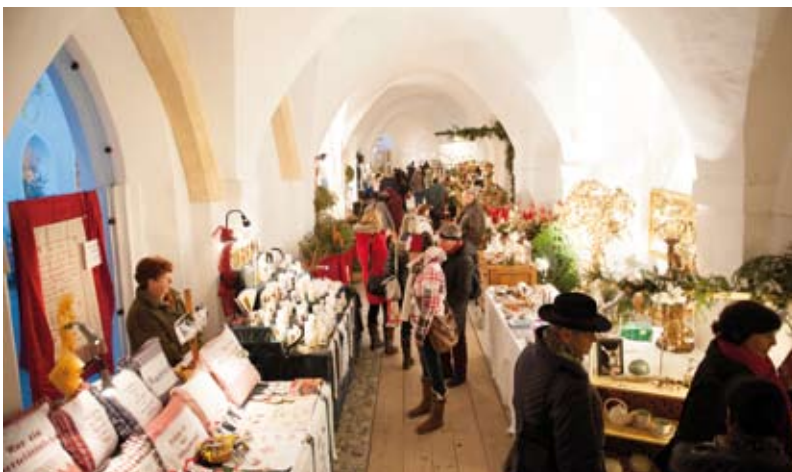
Im Kreuzgang warten verschiedenste Aussteller auf die Besucher.

Das gesamte Programm auf www.mondsee.at/advent