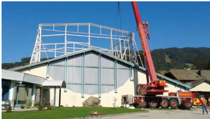
Voraussichtlich ab Jänner soll die Kletteranlage dem Publikum zur Verfügung stehen.

Ab Winter 2015/16 bietet das Kletterzentrum Mondsee mehr als 1200 m 2 Kletterfläche mit allem, was das Herz begehrt: Indoor- und Outdoor Seilkletterbereich, Boulderbereich, Kinderkletter- und Therapiebereich,