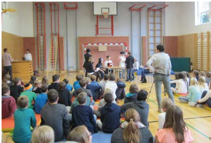
„Die Jagd nach dem verschwundenen Urknödel“ stand auf dem Programm der Theatergruppe.

Schwung an die neue Aufgabe: Die Schüler sollten ein Theaterstück entwickeln, die Rollen verteilen, Kostüme suchen, proben und schließlich auch vor Publikum aufführen! Als Rahmenhandlung dienten Inhalte, die in den von den Schülern geführten Interviews zum Thema Pfahlbau- Weltkulturerbe verstärkt vorgekommen waren. Außerdem sollten Zitate der Interviewten im Theaterstück Platz finden.