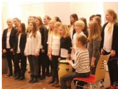
Schüler und Lehrende gaben ein gemeinsames Konzert.

Der musikalische Bogen wurde eröffnet mit dem romantischen Klavierstück Robert Schumanns „Von fremden Ländern und Menschen“ führte über den „Säbeltanz“ von A. Katchaturian hin zum virtuosen Vortrag des „Allegro trisamente“ aus der Sonate für Klarinette und Klavier, von F. Poulenc. Das Streichorchester „Capriccio“ beendete den Abend mit einem schwungvollen Brautlied. Da-