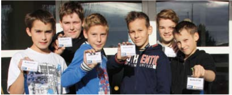
Das Projekt soll einen Beitrag zur Sicherheit auf dem Schulweg leisten.