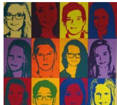
Die Bilder hängen im Gang der SMS.

Gemalt wurden die Porträts in zwei Farben, die hellere Farbe diente zur Grundierung, mit der dunkleren Farbe wurde das Bild ausgestaltet. En bloc aufgehängt entstand aus den 43 Porträts auf Leinwänden im Format 50 x 70 ein poppiges Gesamtkunstwerk.