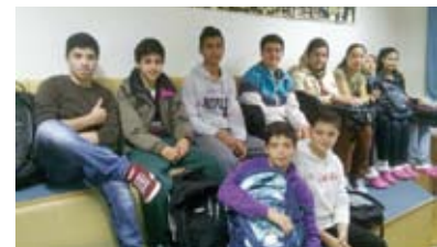
Elf Flüchtlingskinder werden an der Unesco-NMS unterrichtet.

Die Flüchtlingskinder werden täglich mit einem Bus in der Betreuungsstelle abgeholt und nach der vierten Unterrichtseinheit zurückgefahren. Den Schülertransfer finanzieren die vier Mondseelandgemeinden.