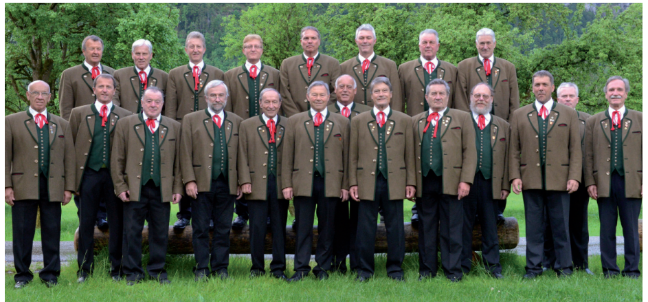
Die Sängerrunde Drachenwand feiert am Samstag, 9. Juli, im Festsaal des Schlosses Mondsee ihr 40-jähriges Bestehen.