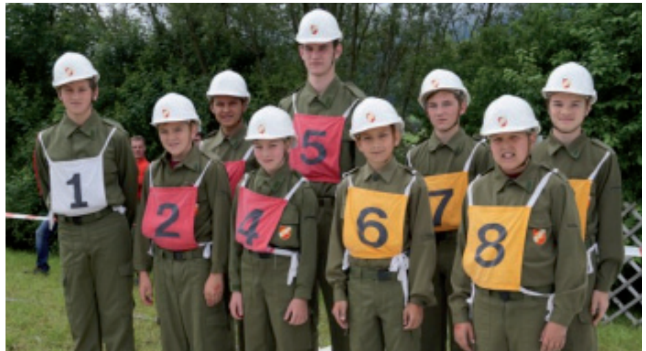
Die Jugendgruppe der FF Keuschen erreichte in der 1. Klasse Bronze den zweiten Platz.

„Der Bewerb ist reibungslos abgelaufen, war unfallfrei und auch der