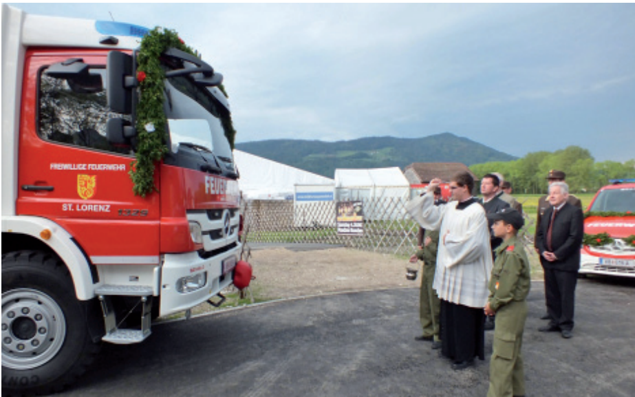
Das neue LFB-A2 (links) sowie das Kommandofahrzeug wurden beim Fest der FF St. Lorenz gesegnet und offiziell in Dienst gestellt.

Dreifachen Grund zum Feiern hatte die Feuerwehr St. Lorenz bei ihrem Fest: Das neue LFB-A2 sowie ein neues Kommandofahrzeug wurden in Dienst gestellt, zudem der Umbau des Zeughauses offiziell eingeweiht. Was