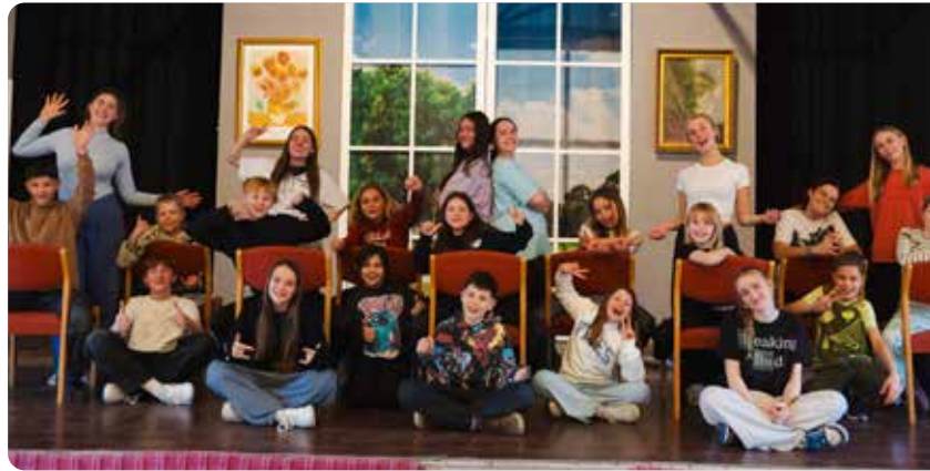
Seit Wochen wird für die beiden Auftritte geprobt.

Songs aus der Pop- und Musicalwelt begleiten die Schüler und Lehrkräfte auf ihrer Reise zum wahren