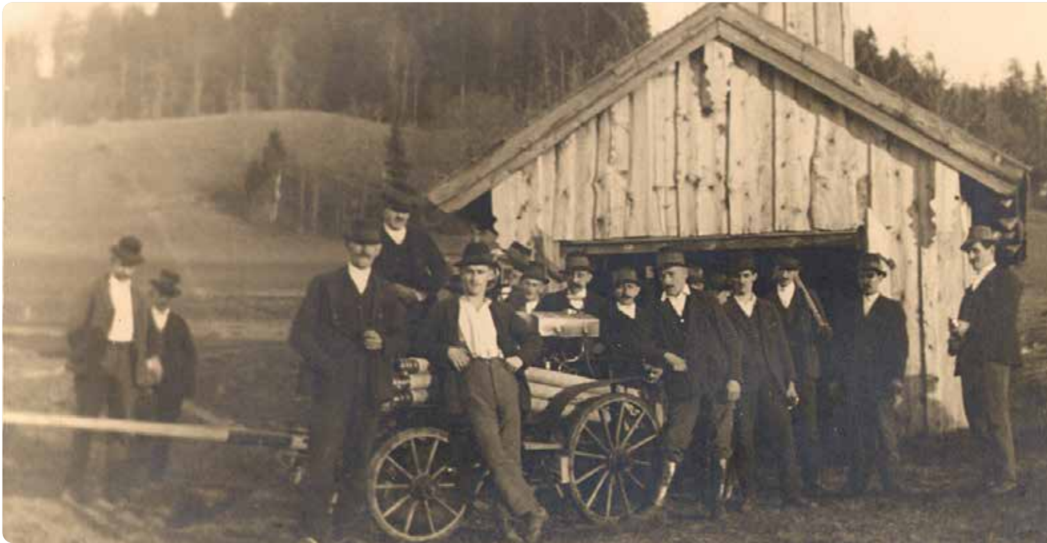
In den Jahren 1926/27 wurde das erste Feuerwehr-Depot beim „Lackinger“ errichtet; das Holz wurde von der Guggenberger Bevölkerung gespendet.