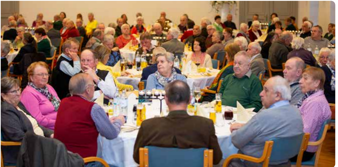
200 Seniorinnen und Senioren aus den Gemeinden Tiefgraben und St. Lorenz folgten der Einladung in den Festsaal des Schlosses Mondsee.