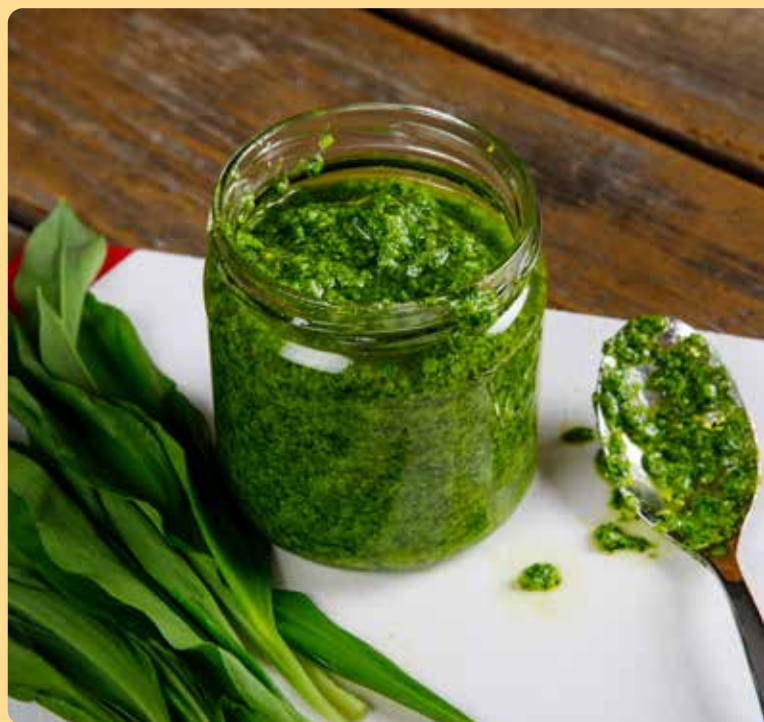
Aus Bärlauch lässt sich u. a. köstliches Pesto zubereiten.

Er wächst übrigens nicht überall so in Hülle und Fülle wie in unseren Breiten und – kaum zu glauben – er steht unter Artenschutz; deshalb ist es nur erlaubt, die Menge für den Eigenverbrauch zu pflücken.