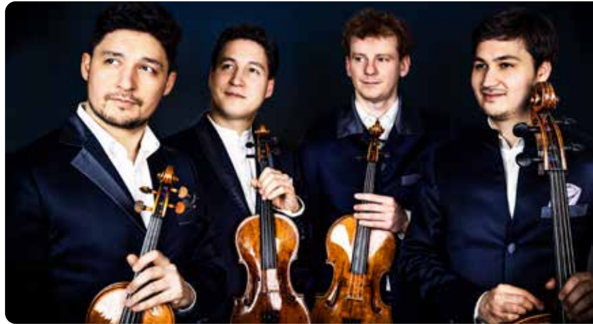
Das Schumann-Quartett spielt heuer bei den Musiktagen in Mondsee.

Musiktage Mondsee, 22. - 30.8.2025. Vorverkauf beim