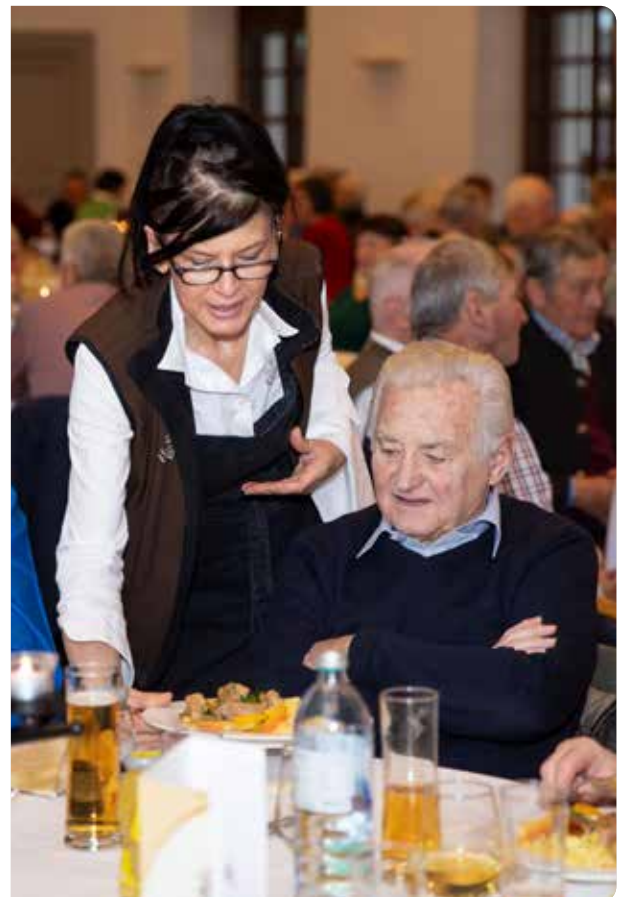
Für das Leibliche Wohl wurden Suppe, Kalbsgulasch oder Kürbisravioli, und zum Abschluss Kaffee und Kuchen serviert.