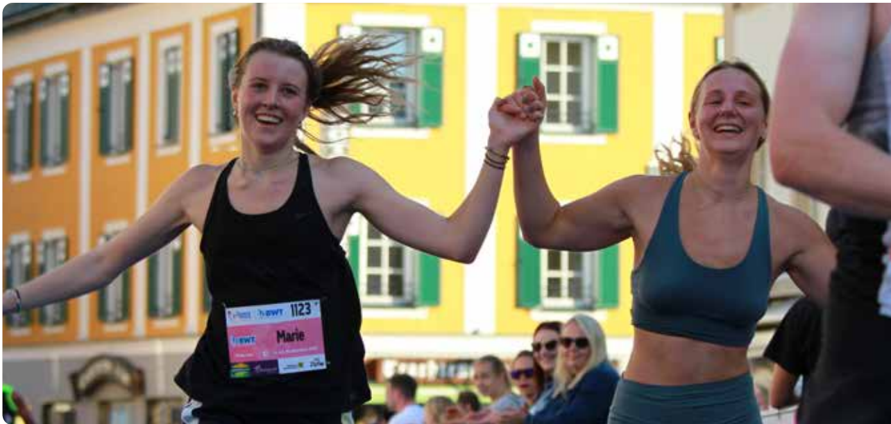
Beim Mondseelauf geht's nicht nur um die Leistung, auch Spaß sollte dabei sein.