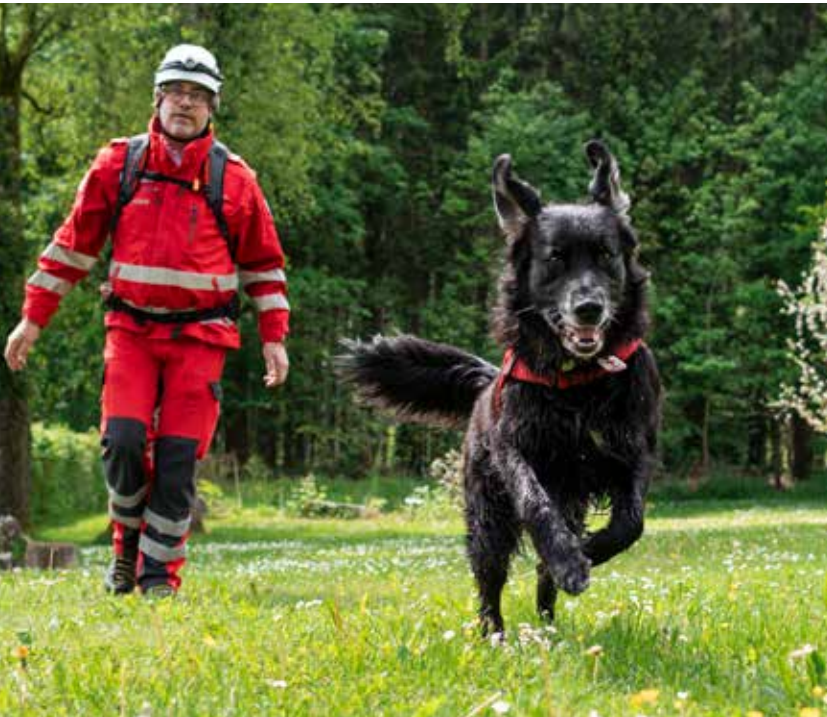
Suchhund „Sunny“ im Einsatz mit einem Hundeführer.

Ihre Stunde schlägt, wenn es vermisste oder verschüttete Personen zu finden gilt: Die Suchhunde der Rot-