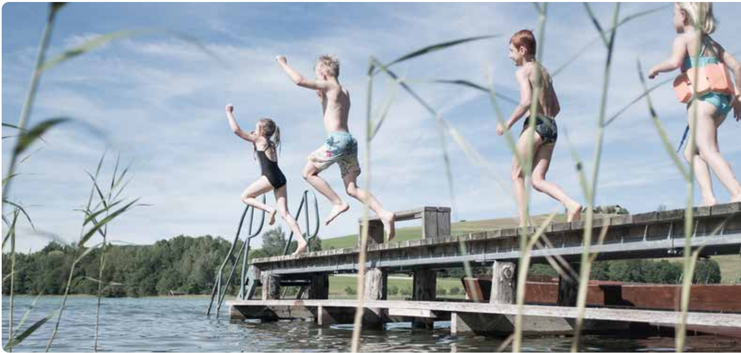
Der Sprung ins kühle Nass ist in den Mondseelandgemeinden bei vier öffentlichen Badeanlagen möglich.