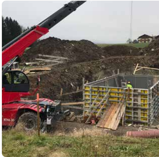
Die Arbeiten an der Errichtung des neuen Löschteiches sollen bis zum Jahresende größtenteils abgeschlossen sein.

Im Herbst wurden zudem die Sanierungen der Gemeindestraßen Achort und Wendt abgewickelt. In Achort wurde ein Teilstück neu asphaltiert. Der Abschnitt wies zuvor deutliche Fahrbahnschäden wie Rissbildungen und Schlaglöcher auf, weshalb die Sanierung erforderlich war. In Wendt sind die Sanierungsarbeiten in der Endphase. Dabei wird der Unterbau vollständig erneuert, um eine langfristige Tragfähigkeit zu gewährleisten. Zusätzlich wird die Oberflächenwasserführung verbessert. In die beiden Straßen wurden rd. 260.000 Euro investiert.