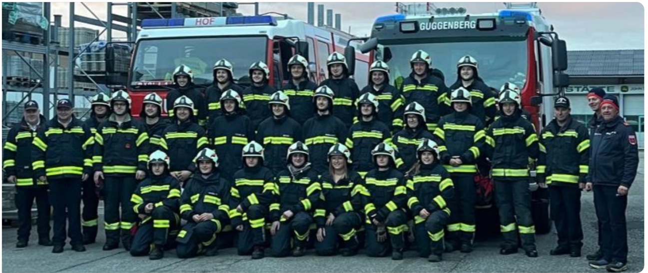
27 Mitglieder der Feuerwehren Hof und Guggenberg dürfen sich freuen: das Technische Hilfeleistungsabzeichen wurde erfolgreich abgelegt.