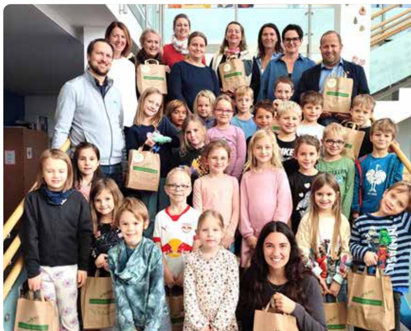
Ein mit regionalen Spezialitäten gefülltes Jausensackerl erhielten die Erstklassler in der VS TiLo.