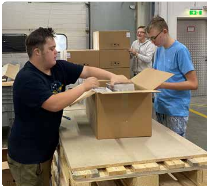
Die Klienten der Lebenshilfe erledigen für Betriebe im Mondseeland unterschiedlichste Auftragsarbeiten

Bei einem stimmungsvollen Jubiläumsfest wurde mit rund 100 Gästen gefeiert. Gemeinsam wurde nicht nur auf das bereits Erreichte zurückgeblickt, sondern auch nach vorne. Die Beziehungen zu Vereinen und Unternehmen sind inzwischen so weit gewachsen,