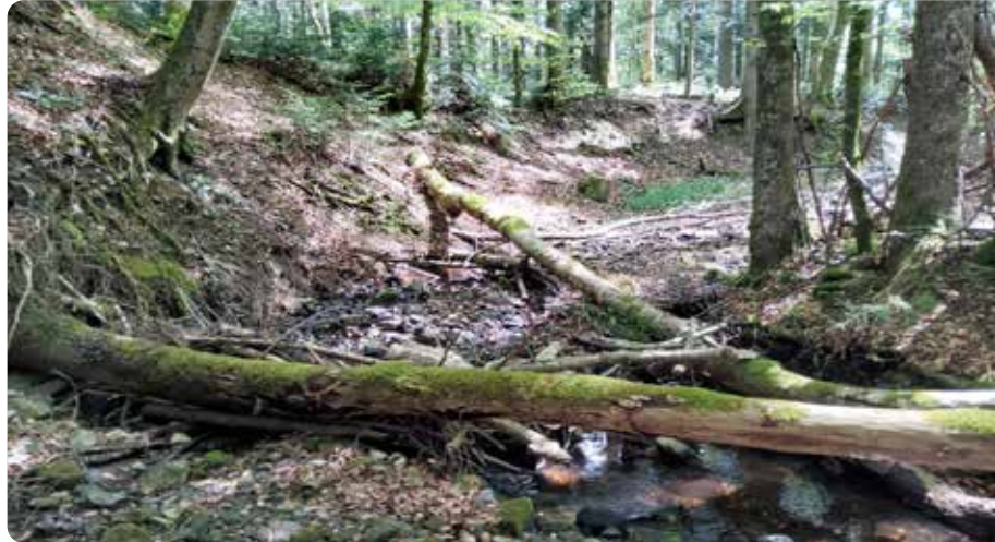
Baumstämme, Äste etc. in Bachläufen können zu Verklausungen führen und sind deshalb regelmäßig zu entfernen.

Diese Überwachung wird in den Gemeinden jährlich durchgeführt und die Missstände werden protokolliert. Das Räumen von Geschieberechen, sollten sie voll sein, wird von der Gemeinde veranlasst. Für die Entfernung von Gehölz (z. B. umgefallene Bäume, große Äste) aus Bachbetten ist der Grundeigentümer ver-