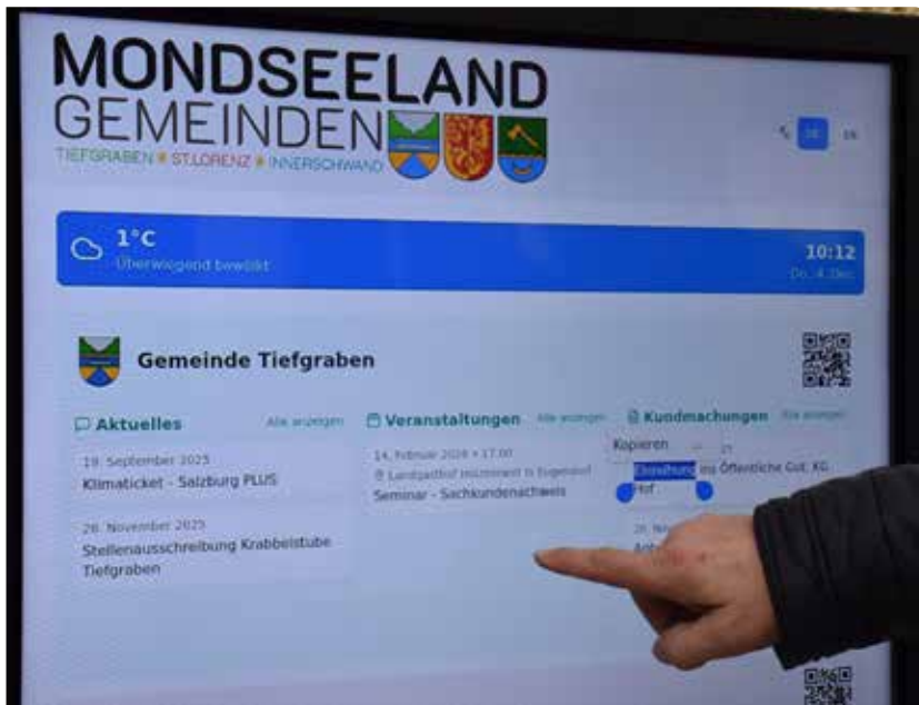
Auf der Digitalen Amtstafel sind Kundmachungen, Veranstaltungen etc. der Gemeinden Tiefgraben, St. Lorenz und Innerschwand zu finden.

Eine digitale Amtstafel beim Eingang zum Gemeindeamt sorgt dafür, dass für die Bürgerinnen und Bürger offizielle Mitteilungen der Mondseelandgemeinden einfach, gut sichtbar und barrierefrei zugänglich sind. Kundmachungen, Veranstaltungen, Stellenausschreibungen, Verordnungen etc. sind rund um die Uhr abrufbar. Größere Schrift und Beleuchtung bedeuten eine bessere Lesbarkeit.