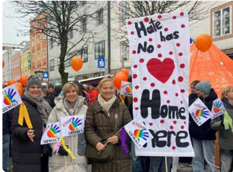
Schülerinnen und Lehrkräfte der Mittelschule Mondsee nahmen in Vöcklabruck am Marsch gegen Gewalt an Frauen und Mädchen teil.

Das Thema Sicherheit für Frauen und Mädchen zieht sich bei NORA wie ein roter Faden durch das Angebot. Heuer nahmen drei Klassen der Mittelschule an den „sicha.is.sicha“-Kursen teil. Mit Plakaten, Transparenten und in Workshops wird das Thema Gewaltprävention ins Zentrum gerückt.