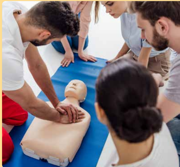
Das Rote Kreuz bietet regelmäßig Erste-Hilfe-Kurse an; Interessierte können sich auch als Ehrenamtliche einbringen.

Möglichkeiten dazu finden sich genug. Bezahlte Nachbarschaftshilfe über die Plattform „ALLFRED“, Mitarbeit in den verschiedensten Vereinen – von der Feuerwehr über das Rote Kreuz bis zu den Sport- oder Musikvereinen, helfende Hände werden immer gesucht. Daher – helfen wir einander gesund zu bleiben!