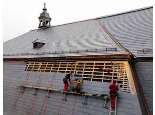
Fast geschafft: Nach eineinhalbjähriger Arbeit verlegen die Dachdecker die letzten Schieferplatten am Dach der Basilika.