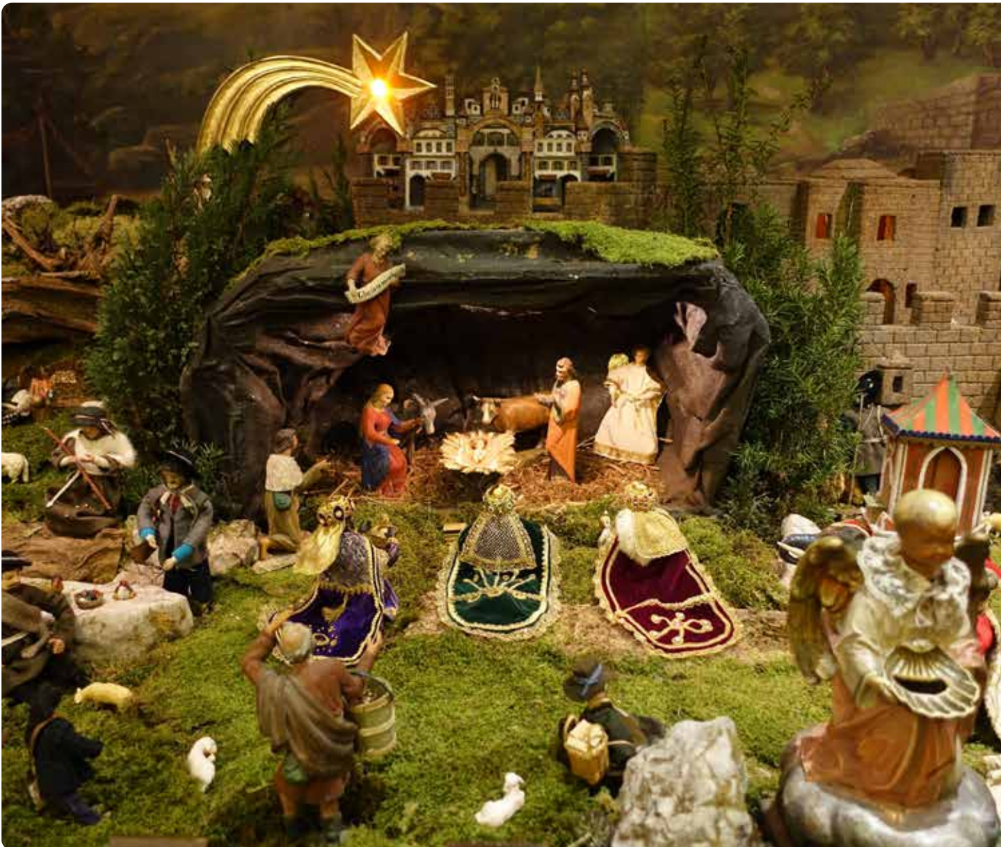
Blick in die Krippe der Basilika Mondsee.