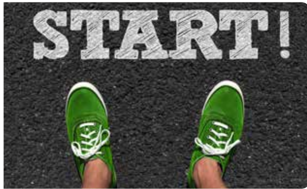
Oft bedarf es nur der ersten Schritte, um den inneren Schweinehund zu besiegen.

zurücklegen. Zwischendurch ein paar Kniebeugen, sich die Zähne auf einem Bein stehend zu putzen oder die Arbeit am PC mit ein paar Schulterübungen zu unterbrechen – das erfordert wenig Zeit und Aufwand. Oder verbinden Sie sportliche Aktivität mit angenehmen Dingen: Genießen Sie die frische Luft und die Natur beim Radfahren, hören gute Musik, einen Podcast beim Nordic Walking oder spazieren gemeinsam mit Freunden.