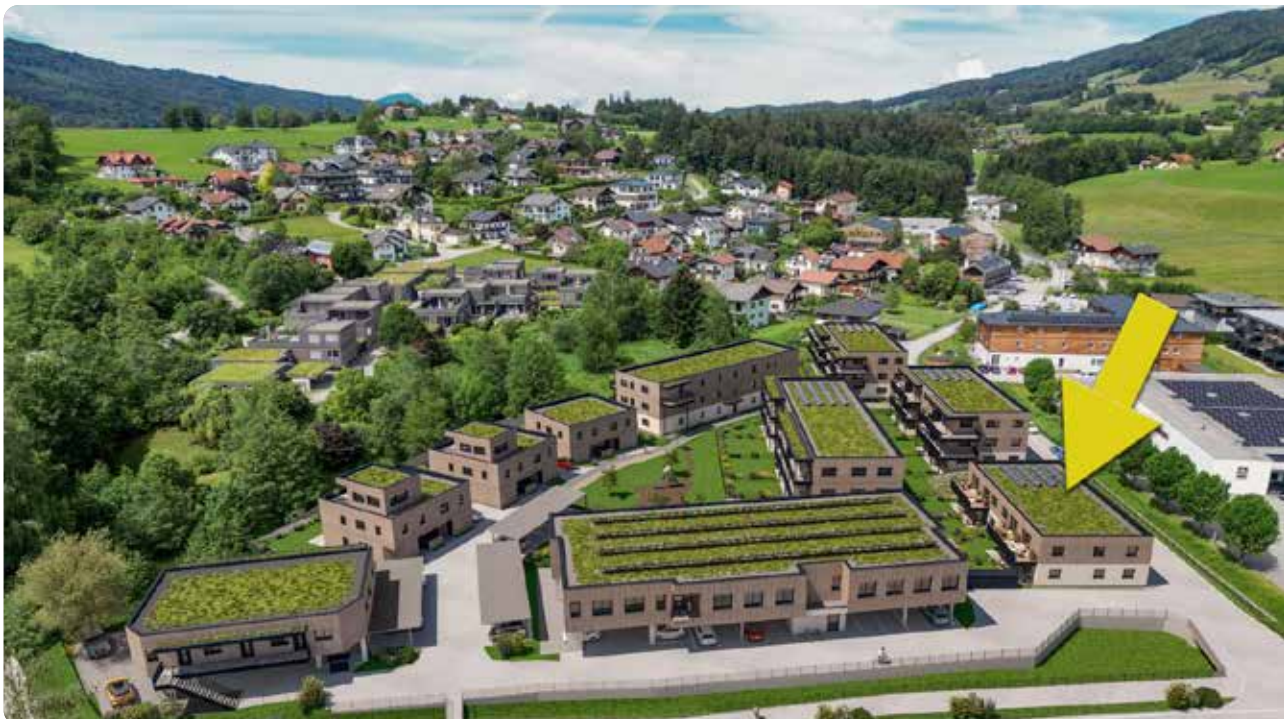
In diesem Objekt (gelber Pfeil) befinden sich die acht Wohnungen, für die sich Bürgerinnen und Bürger aus den vier Mondseelandgemeinden ab sofort bewerben können.

Interessenten werden ersucht, ihre Bewerbung mit Name, Adresse, Tel.-Nr. sowie Bekanntgabe der gewünschten Wohnung zu versehen. Je nach Anzahl der Bewerbungen wird nach Ende der Bewerbungsfrist das weitere Vorgehen im Vergabeprozess festgelegt.