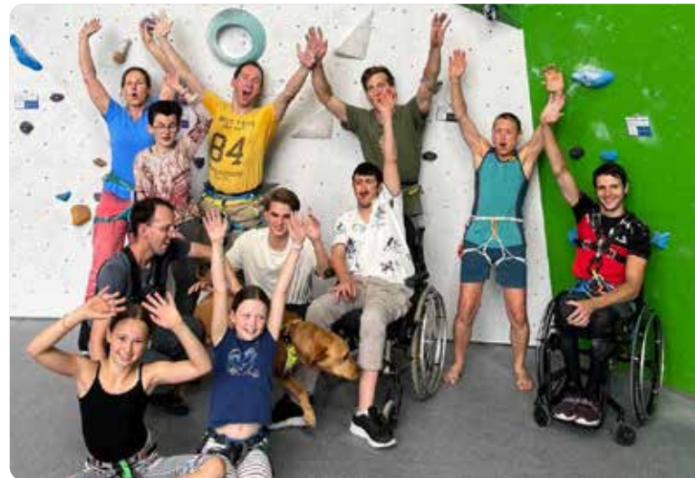
Der Alpenverein will auch Menschen mit Behinderung Kletter- und Bergerlebnisse ermöglichen.

Höhepunkt 2026 wird die Schafberg-Messe am Sonntag, 16. August, mit der Weihe des neuen Gipfelkreuzes; aufgestellt wird das neue Gipfelkreuz bereits im Frühsommer.