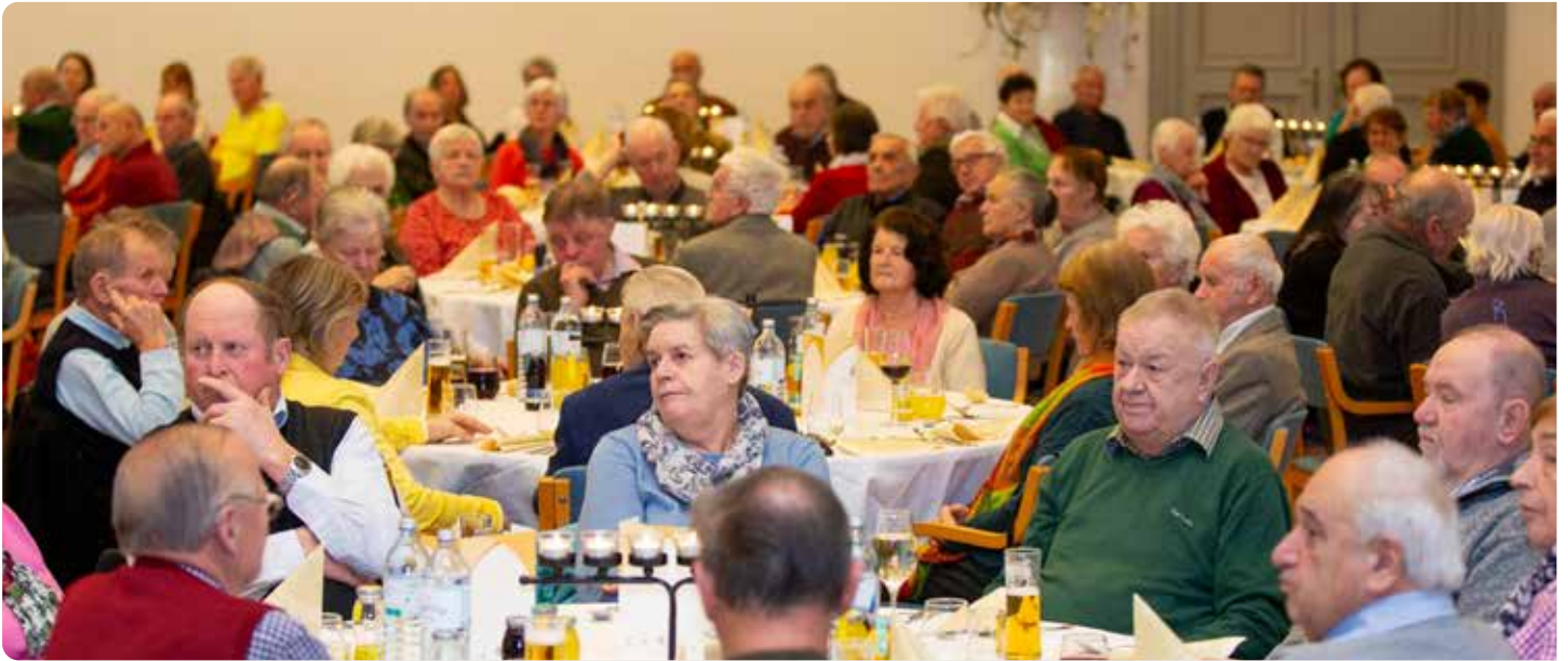
Seniorinnen und Senioren aus Tiefgraben und St. Lorenz sind am Mittwoch, 22. April, wieder ins Schloss Mondsee eingeladen.