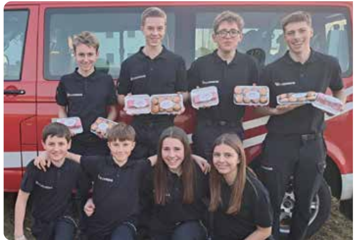
Die Guggenberger liefen beim Jugendcup in Tragwein Tagesbestzeit.

Bei einer Eisretterschulung wurden theoretische Grundlagen und praktische Techniken vermittelt, um Personen sicher aus eiskaltem Wasser zu retten, ohne sich selbst in Lebensgefahr zu bringen. Themen im Praxisteil waren u. a. die Gewichtsverteilung, der Einsatz von Rettungsmitteln oder das richtige Verhalten für den Fall, dass man während eines Einsatzes selbst ins Eis einbricht. Zu den theoretischen Grundlagen gehört Wissen über Eisdicke, das Erkennen von Tragfähigkeiten, die Einschätzung von Eisbrüchigkeit und Strömungen sowie medizinische Aspekte